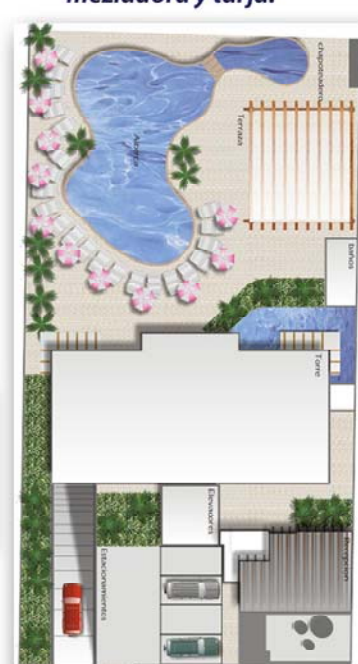
Planta General Conjunto